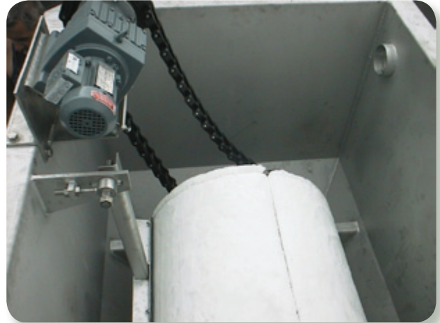
Vista interna del filtro de medio textil AquaDrum®.